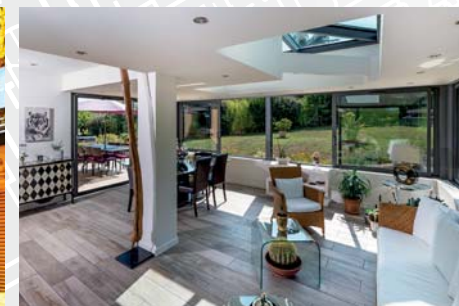
Réalisation d'une extension d'habitation pour une maison individuelle à Limas (69)