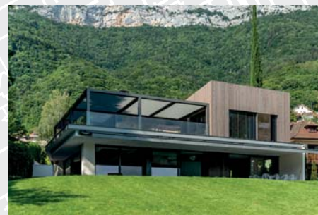
Réalisation d'une pergola pour une maison d'habitation à Veyrier-du-Lac (74)