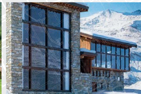
Hôtel restaurant le "Refuge de Solaise", 2551 m d'altitude, à Val d'Isère (73)