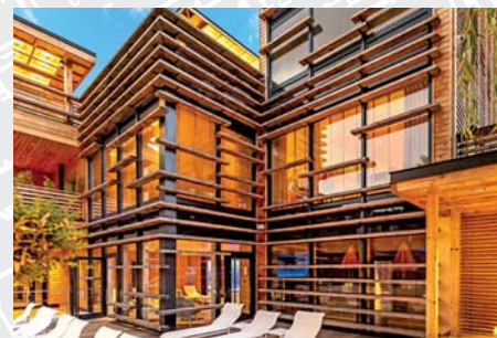
Villa Loiseau des Sens à Saulieu (21)