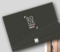
Les plus belles réalisations TIASO regroupées dans un Book.