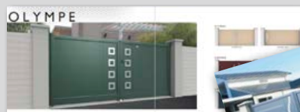
Lancement de 51 nouveaux modèles de portails pour la collection "Créative" chez ROCHE.