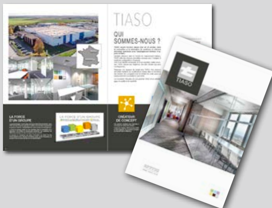
Nouvelle dynamique et refonte graphique des brochures GROUPE et TIASO.